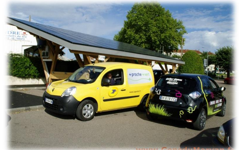
Plateforme multimodale Parking Gare SNCF