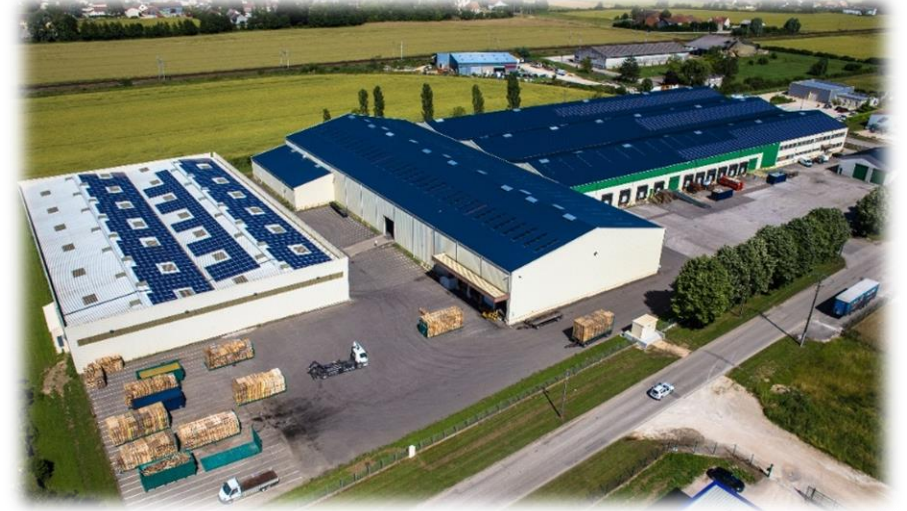
Bâtiments industriels logistiques